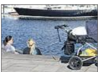
SOMMER i havna var det tirsdag.

HOLMESTRAND: Politiet rykket tirsdag kveld ut til en adresse i Holmestrand etter melding om en person som skadet seg selv med en stor kniv. Det ble gitt ordre til bevæpning, men politiet fikk kontroll på mannen uten at denne ble utført. Mannen ble tatt hånd om av helsevesenet.