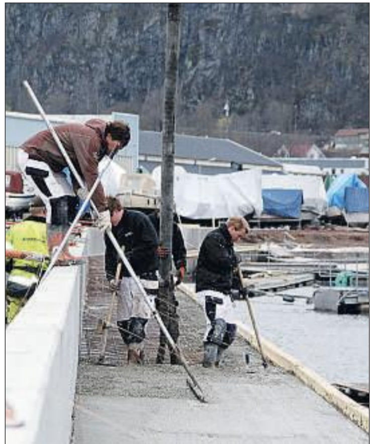
PROMENADE: Den første strekningen med havnepromenade på Hakan ble støpt i går med 80 kubikk betong i to meters bredde.