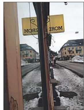
HER i Langgaten ligger 2ROM.

– Dette er pasjonen min. Jeg har mange sommerfugler i magen. Jeg håper 2ROM kan fylle et behov i Holmestrand, sier gründeren.