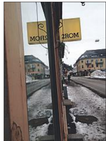
HER i Langgaten ligger 2ROM.

– Dette er pasjonen min. Jeg har mange sommerfugler i magen. Jeg håper 2ROM kan fylle et behov i Holmestrand, sier gründeren.