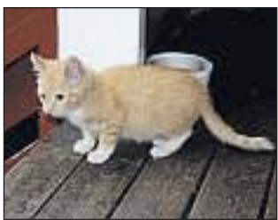
BORTE VEKK: Eieren til katten etterlyses.