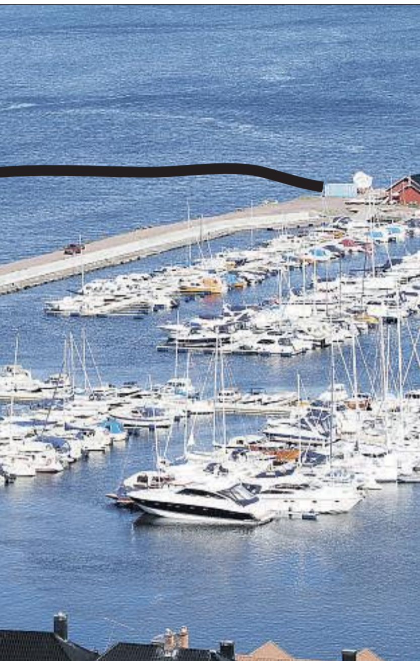
and til havneområdet i Holmestrand med tunnelstein. Blir innstillingen til rådg andre instanser har sagt sitt.