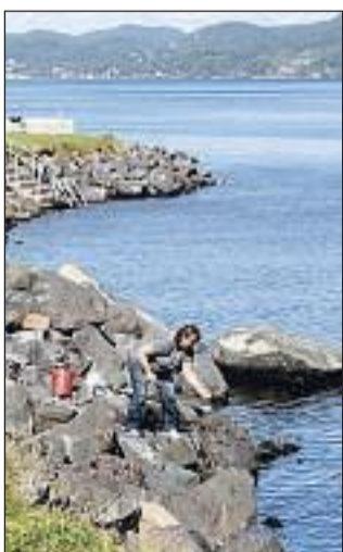
MAKRELLFISKE: Bare én makrell ville bite utenfor Dulpen tirsdag.

HOLMESTRAND/COGNAC: Året 1940 bryter det ut krig i Europa og verden står nok en gang overfor alvorlige utfordringer. Rasjonerings og arrestasjoner blir dagligdags og folk frykter fremtiden. Men i Cognac-distriktet fortsatte man med sitt arbeid for å videreføre tradisjonene. Denne rene årgangscognacen fra andre verdenskrig er enkel og elegant innpakket i sin unike flaske inspirert av den gamle meglerens kolbe. Det er tappet 36 nummererte flasker av denne, og ved å eie en flaske 1940 har man ikke bare en sjelden Cognac med aner fra Holmestrand, men også et eksepsjonelt objekt som har vært vitne til et stykke krigshistorie.