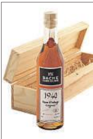
1940: Med krigen i minne blir denne årgangen ekstra spesiell.