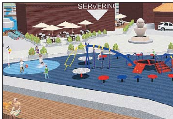
BÅTSENTERET skal rives i høst. Kan en rekreasjonsarena inneholde servering og lekeområde? (Illustrasjon: Jon Mørk)