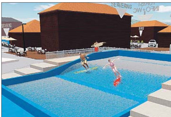
FLOWRIDER: Hakan og Krana som rekreasjonsområde. Med blant annet kunstig surfebølge? (Illustrasjon: Jon Mørk)