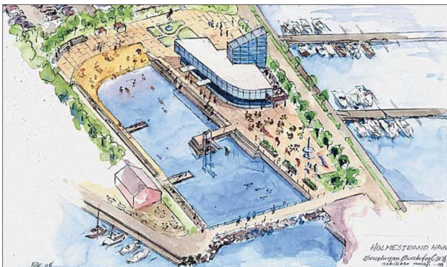
BLÅ LAGUNE: - Vi har klekket ut en idé som går ut på å gjøre "jollebukta" om til et gedigent utendørs sjøvannsbasseng med sandstrand og gode badetemperatur året rundt. Vi ser for oss et servicebygg som inneholder vannrelaterte fasiliteter som for eksempel boblebad, iskulper, tyrkisk dampbad, badstuer, solarier, garderobes, i tillegg til restaurantdrift både ute og inne. Kanskje burde byens treningsstudio også ligge i dette bygget, sa Holmestrand Utvikling AS, da ideen ble lansert for noen år siden.