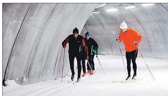
FRA TORSBY: Bildet er fra skitunnelen i svenske Torsby, der løpere kan trene både langrenn og skiskyting, med innleide instruktører om man ønsker.