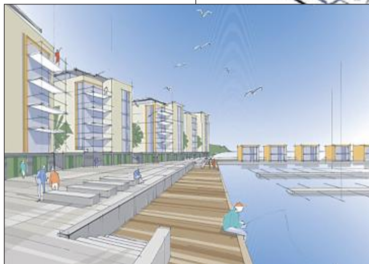
OMFATTENDE: Skissene viser den omfattende utbyggingen. Rom eiendom skal sammen med hotellet.