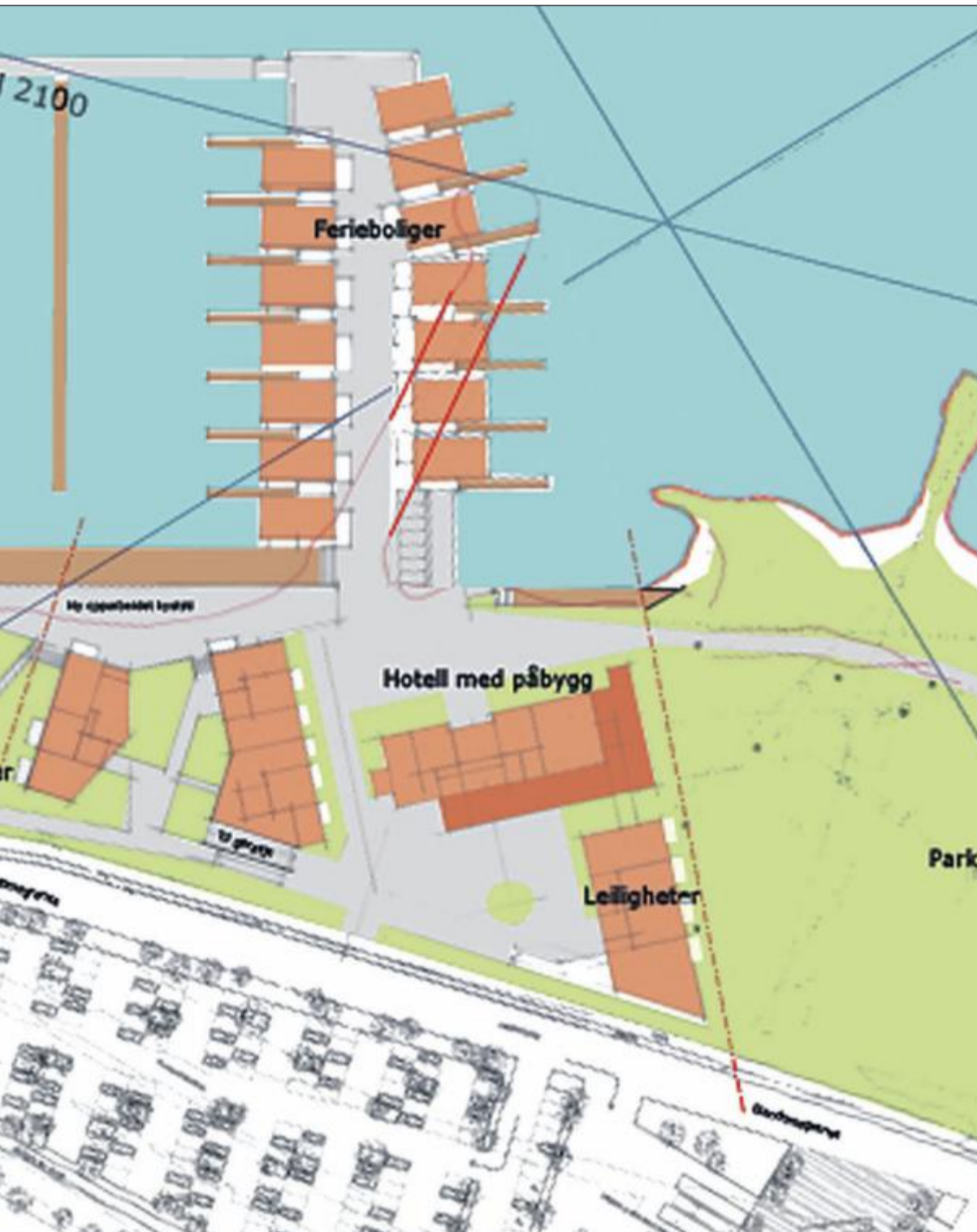
de planlagte utbyggingen som er tenkt på eiendommen til Holmestrand fjordhotell og områdene ved og rundt hotellet se på muligheten for utvikling i samarbeid med kommunen. (Skisser: Link Arkitektur)

HOF: Vesar leverer for tiden ut enkle grønne ekstrasekker i kommunene Andebu, Stokke og Hof, samt enkelte steder i Tønsberg. Grunnen er endring av henteruter fra 1. januar, og det vil være litt lenger henteintervaller ved overgangen til nytt år. Den grønne ekstrasekken kan brukes til ekstra restavfall i denne perioden. Ekstrasekken må settes ut ved avfallsbeholderne på hentedagen for restavfall.