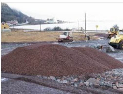
MULVIKA: En boligrikk og to lager-telt skal blant annet ta plass i Mulvika. Rigger settes opp om et par uker etter planen.