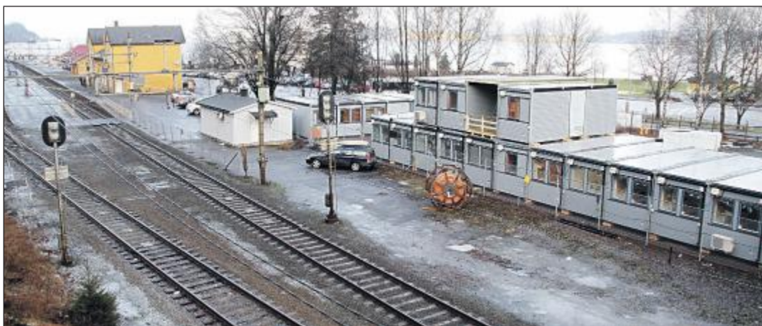
SØR FOR STASJONEN: Rigger seg til gjør også Skanska ved stasjonen, i likhet med området nord for fjordhotellet.