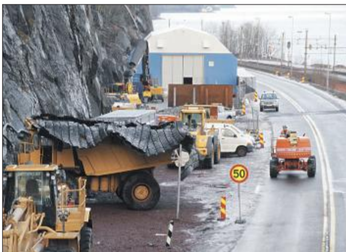
RIGGOMRÅDE: På nordsiden av Holmestrandtunnelen har Skanska satt opp et verkstedtelt, sikret fjellveggen og pigget og rensket veggen for å gjøre klart til sprengningsarbeider.

Adkomsten sør for stasjonen skal sprenges ut innenfra.