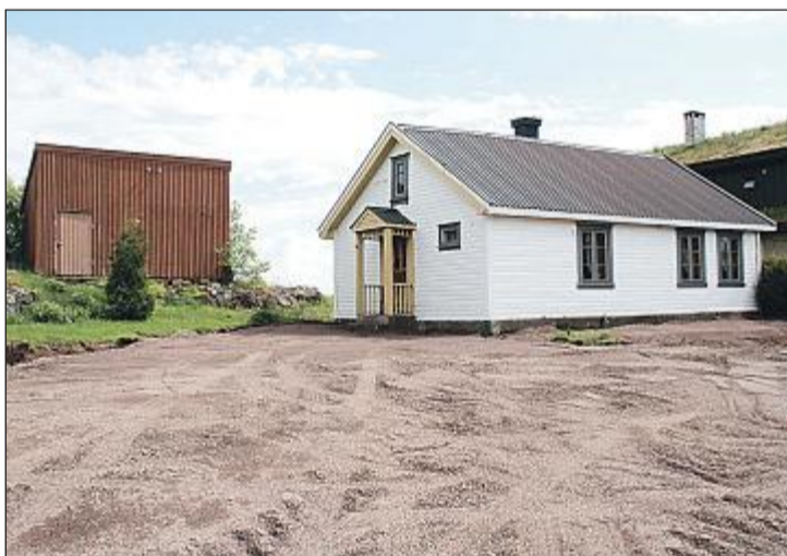
I GANG: Gjerdet og plenen er fjernet ved Roveveien 24. Demontering av huset begynner trolig før St. Hans.

- Fra vår side skal en formell sak angående selve huset diskuteres i møtet som Kirkelig fellesråd har i morgen. Videre er planen å bruke en del tid på en detaljert gjennomgang av husets konstruksjon, merking av tøm-