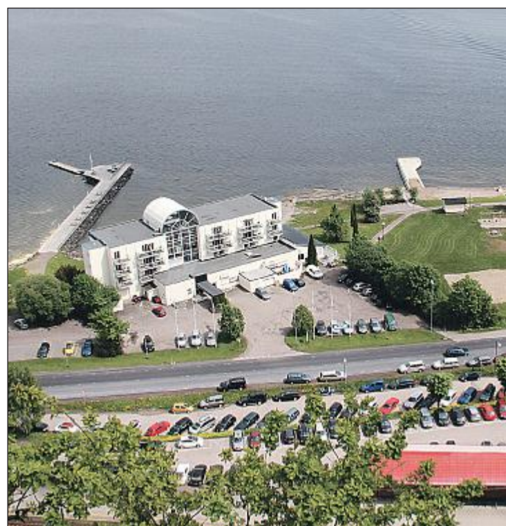
FLERE BEMERKNINGER: Holmestrand bys vel har flere bemerkninger til planene for Strandholmen brygge.