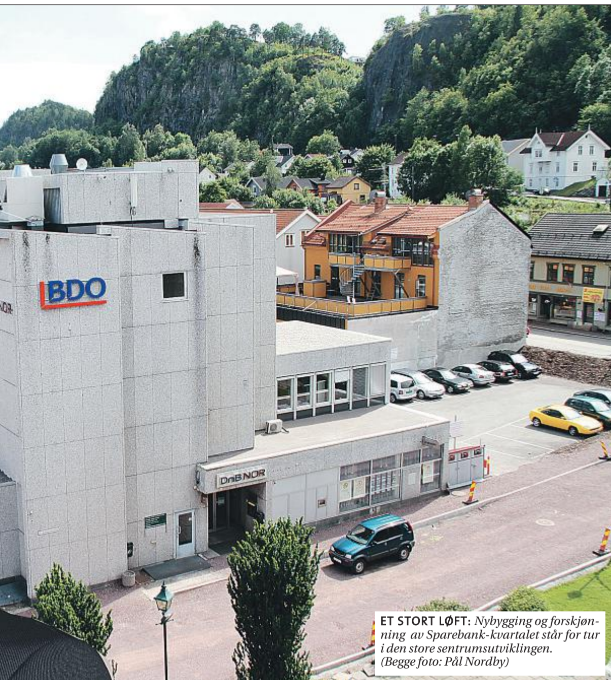
ET STORT LØFT: Nybygging og forskjøning av Sparebank-kvartalet står for tur i den store sentrumsutviklingen.