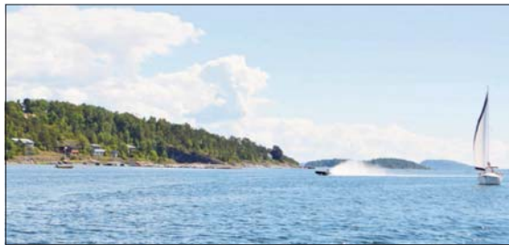
FARTSSVIN: Spruten sto til værs da denne båtføreren passerte Killingholmen i stor fart.

- Jeg må innrømme at vi har patruljert lite i sjøen der, og også fått lite tips. Bekymrer dette mange, må vi kanskje prioritere annerledes, sier han.