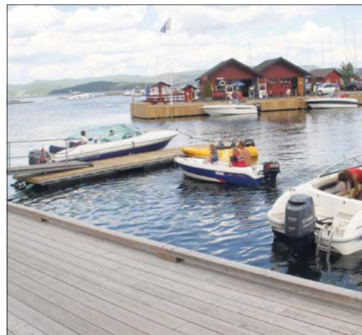
POPULÆRT: Gjestehavna har opplevd yrende liv i sommer.