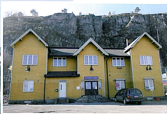
VED EN VEGG: Dagens stasjon med tilhørende sporområde ligger ved en fjellvegg, noe som hindrer byutvikling.