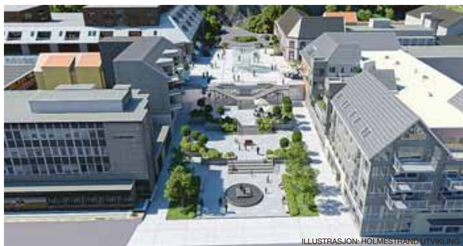
HOLMESTRAND TORG Byen står foran en total forvandling

En ny og miljøvennlig by er i ferd med å vokse frem ved kaikanten tre kvarter fra Oslo. Holmestrand har fått tidenes mulighet i fanget, og griper den begjærlig. Om et par år sier ikke folk «Look to Drammen»; da sier de «Look to Holmestrand»!