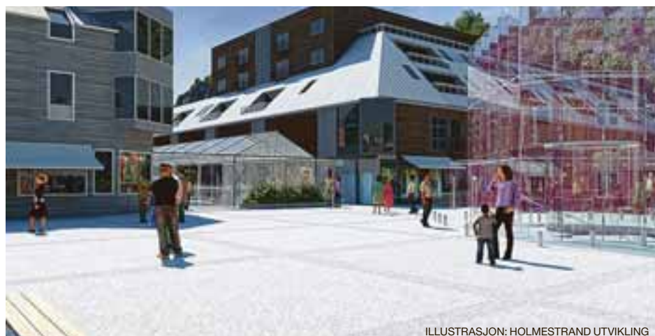
FEM SENTRUMSKVARTALER En bypark som vil binde sammen boliger og forretninger i en idyllisk beliggenhet ut mot sjøen