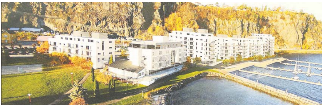
STRANDHOLMEN BRYGGE: Sarpsborg-firmaet Presiz Eiendom vil bygge 66 leiligheter i de to blokkene nærmest hotellet. Byggene Rom Eiendom planlegger mot nord er trolig noe lenger fram i tid.

- En såkalt luft-til-vann-varmepumpe står på taket og sørger for varmen. Den er energieffektiv, og er derfor bra for både miljøet og lommeboka, forklår