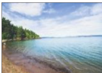
SANDSLETTA: Rolige og oversiktelige omgivelser i Re.

Kiosktilbud: Ingen. Nærmeste er i Stokke sentrum.