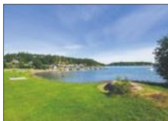
GOD Plass: Nesten på grensen til Sandefjord trenger du ikke å kjempe om plass på stranden.

Kiosktilbud: Kiosk i luke, med strandvarer og noe varmmat.