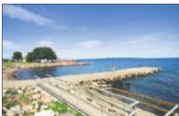
BADEPARKEN: Rullestolrampe på stranden og litt lekeapparater, alle kan ta turen til Åsgårdstrand.