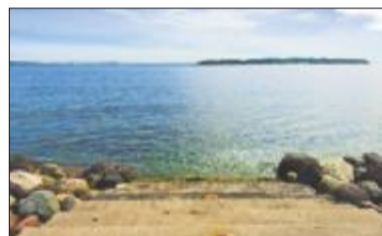
RØRESTRAND: Liten sandstrand, men allikevel mulighet for utfoldelse på gressplenen i Horten.

Kiosktilbud: Minimalt utvalg, vanlige kioskvareer. Men bruket er nytt, god hylleplass til flere varer.