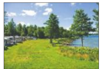
ØRASTRANDA: Knuste flasker var en del av campingturistenes strand.

Kiosktilbud: På campingplassen et stykke unna, med tradisjonelle kioskvareer. Ingen blader.