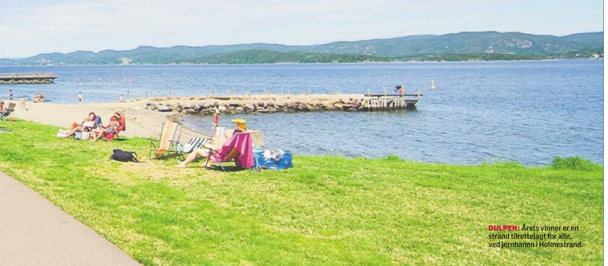
DULPEN: Årets vinner er en strand tilrettelagt for alle, ved jernbanen i Holmestrand.