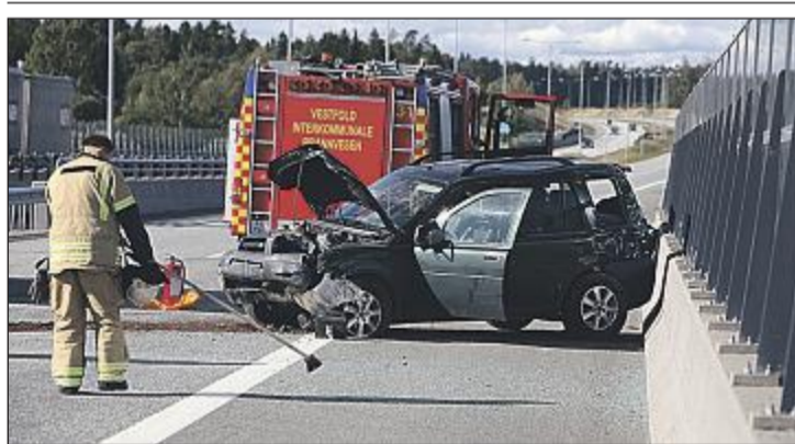
UTFORKJØRING: Nok en bil kjørte galt på Skjeggstadbrua på E18 ved Holmestrand.