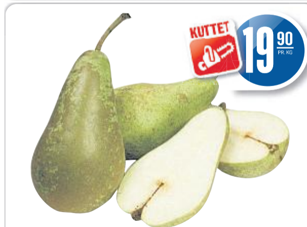
PÆRER CONFERENCE Løsvekt, 19,90 pr. kg

Gjelder Telemark, Vestfold, Buskerud, Asker og Bærum uke 39 - Kun til private husholdninger. Vi tar forbehold om eventuelle trykkfeil og at noen varer kan være utsolgt.