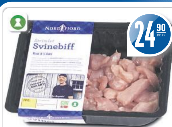
Fersk STRIMLET SVINEBIFF Nordfjord, 300 g, 83,00 pr. kg