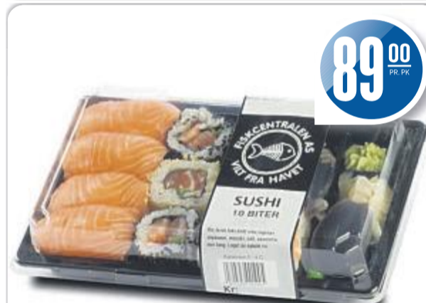
Fersk SUSHI 10 BITER Fiskcentralen, 290 g, 306,90 pr. kg