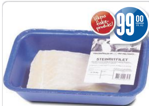
Fersk STEINBITFILET Fiskcentralen, 99,00 pr. kg. Produsert av frossent råstoff.